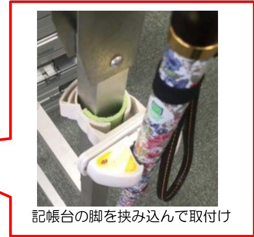
記帳台の脚を挟み込んで取付け