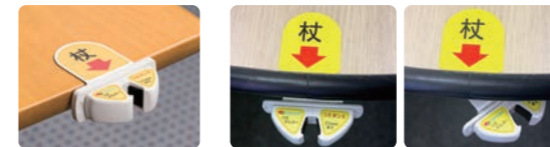
テーブル上部へ貼付 テーブル裏にネジ止め(格納できます)