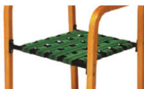
MC(ウェービングテープ構造)

MCは通常の合板構造とは異なり、ウェービングテープを使用しております。ウェービングテープを使用することでクッション性に優れた座り心地を実現しています。