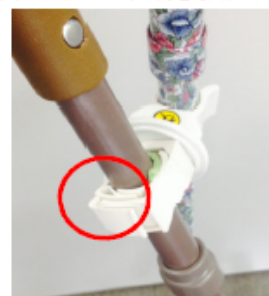
角度を決めて固定