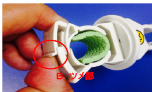
外れにくい場合は B ツメ部を持ち上げながら コインをひねって下さい。