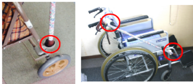
必要に応じ2ヶ所使用